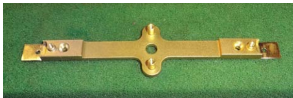
Fraisage des emplacement des attelages