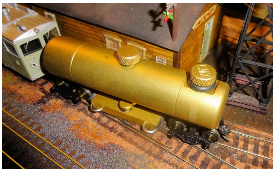
Le wagon terminé