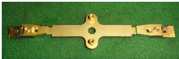
Fraisage du châssis pour le passage des roues