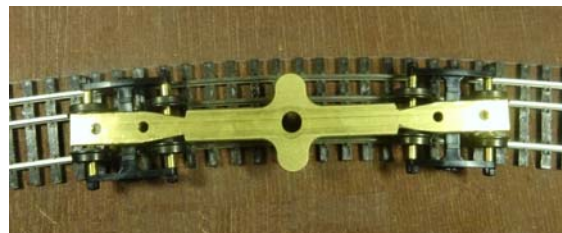
Présentation sur une courbe de R: 600 mm